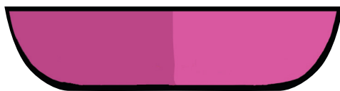
Rabat capot à scotcher page 13