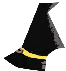
Chapeau à scotcher page 13