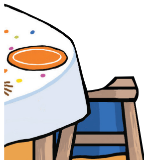
Pochette tabouret à scotcher page 13