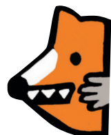
Masque à scotcher page 15