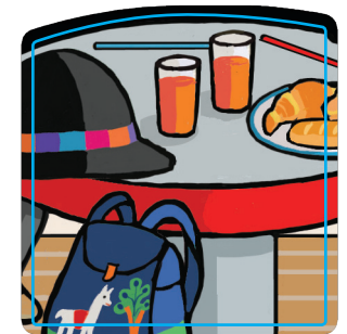
Pochette-table à scotcher page 13 pour installer Lili Souris puis la ranger après le jeu