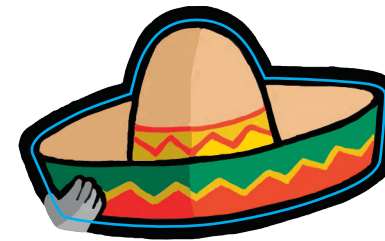
Chapeau à scotcher page 11