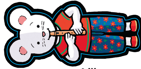
Lili Souris à promener de page en page

Plier le long des pointillés. Coller les éléments et découper.